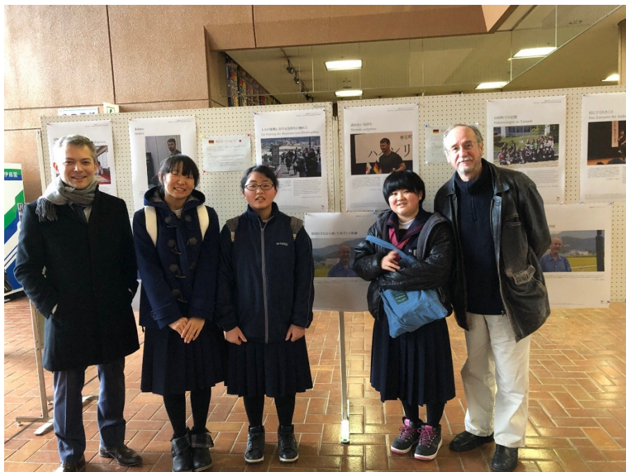
(岩手県雫石町の中高生が作成したホストタウンポスターの掲示 2019年1月)