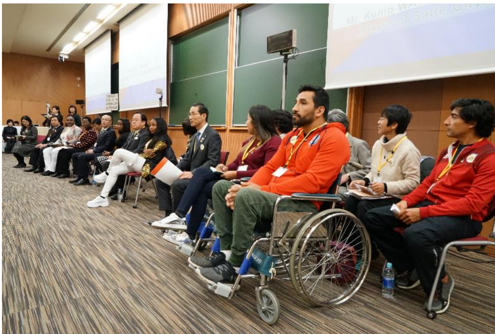
(ホストタウンサミット「女性アスリート・パラアスリート座談会」 2019年2月)